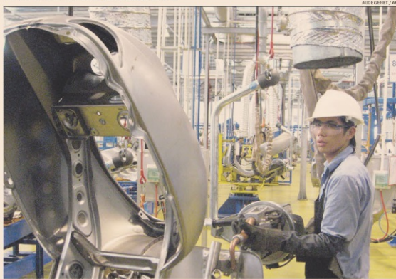
Paesi emergenti. Catena di montaggio della Vespa Piaggio in Vietnam